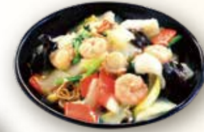
海鮮餡かけ焼きそば