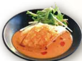
蒸し鶏の細切り 辛子胡麻ソース