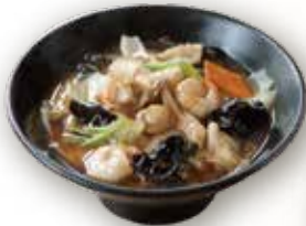
五目入りスープそば