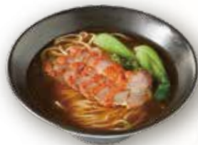
チャーシュー入りスープそば