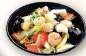
海鮮餡かけ焼きそば