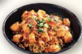
麻婆餡かけ焼きそば