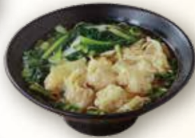
ワンタン入りスープそば