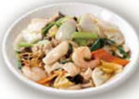
五目餡かけ焼きそば