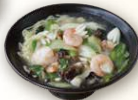
海鮮入りスープそば