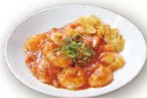
海老のチリソース