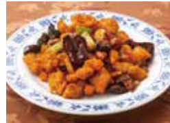
13. 鶏肉の唐辛子炒め (宮保鶏丁)