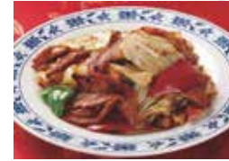
16. 豚バラ肉とキャベツの辛味噌炒め (回鍋肉片)