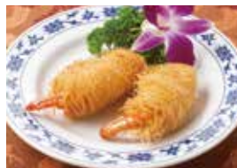
35. 海鮮のカダイフ巻き揚げ (海鮮龍鬚捲)