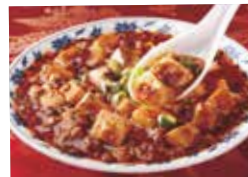
20. 麻婆豆腐 (麻婆豆腐)