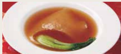
101. フカヒレの姿煮 (紅焼排翅)