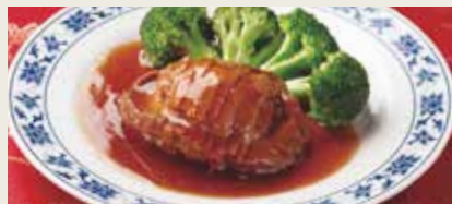
102. 丸ごと鮑のオイスターソース煮込み (蚝皇原只鮑魚)