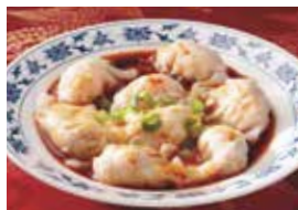
31. 特製海老入り水餃子 辛味ニンニクソース (紅油水餃子)