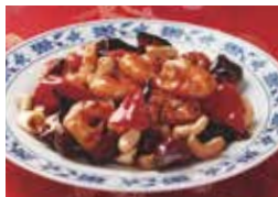
4. エビの唐辛子炒め (宮保蝦仁)