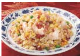
27. 五目入りチャーハン (什錦炒飯)