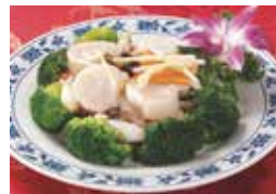
5. ホタテの塩味炒め (油泡扇貝)