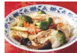
23. 五目野菜のオイスターソース炒め (蠔油什錦)