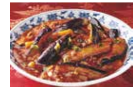
25. 茄子と挽き肉のニンニク辛し煮 (魚香茄子)