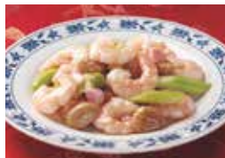
2. エビの塩味炒め (油泡蝦仁)